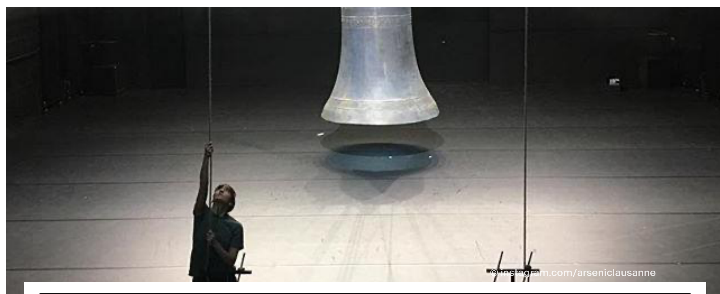
Théâtre: Lignes de conduite / Vertigo / 3 min. / le 20 avril 2018

>> A écouter, l'interview de Maud Blandel au micro de Vertigo :