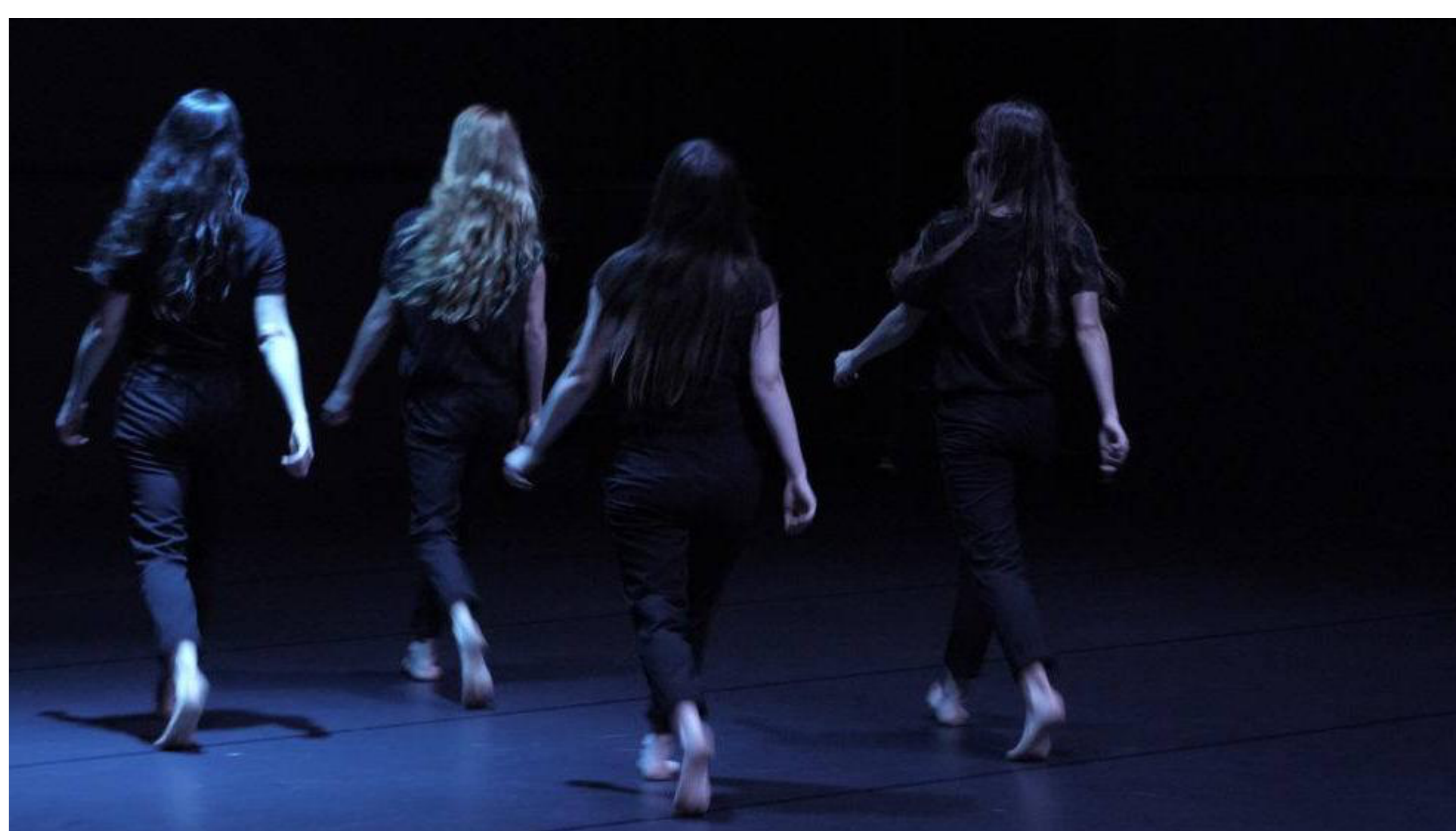
"Lignes de conduite", quatre danseuses dansant la tarentelle sur une chorégraphie de Maud Blandel. - [ADC]

Quatre danseuses lancées dans un quadrille infernal... C'est "Ligne de conduite", un spectacle de danse à découvrir à Genève, salle de l'ADC, jusqu'au 4 novembre.