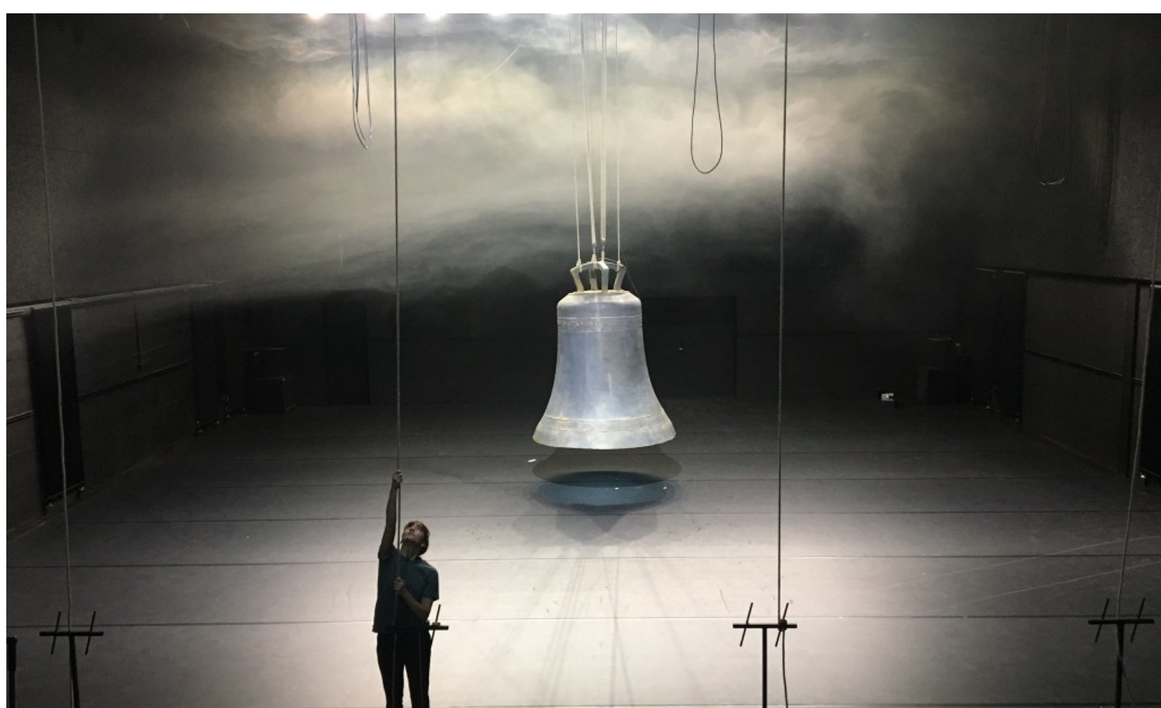
« Lignes de conduite » © Maud Blandel

Il fut un temps où croire avait un sens, et en ce temps les âmes dansaient, persuadées que le réel n'était qu'un écran de fumée que seuls les gestes et la musique pouvaient dissiper. C'est de ce temps que Maud Blandel nous parle avec « Lignes de conduite ». De ce temps et de tout ce qui nous sépare de Rhadamanthe, de l'Élysée et de son éternel printemps.